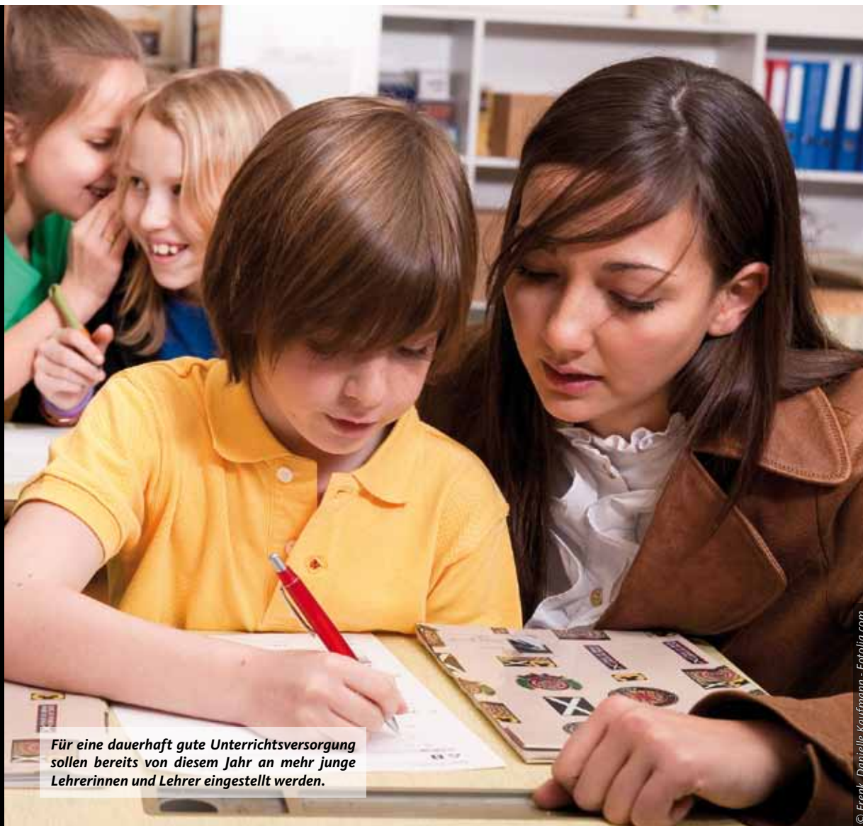
Für eine dauerhaft gute Unterrichtsversorgung sollen bereits von diesem Jahr an mehr junge Lehrerinnen und Lehrer eingestellt werden.

Thüringen soll noch in diesem Jahr mindestens 100 und ab 2011 jährlich rund 500 junge Lehrer neu einstellen. Das hat jetzt auf Antrag der CDU-Fraktion der Thüringer Landtag beschlossen. „Thüringens Schüler schneiden in nationalen und internationalen Vergleichen hervorragend ab. Unsere Schulen sind Spitze, und darauf wollen wir weiter aufbauen“, sagt Fraktionsbildungs-experte Volker Emde. Die sehr gute Schüler-Lehrer-Relation in Thüringen und altersgemischte Lehrerkollegien sind für Emde eine Grundvoraussetzung, um die Schul- und Unterrichtsqualität weiter steigern zu können. „Zugleich bieten wir jungen und gut qualifizierten Lehramtsstudenten auf diese Weise eine berufliche Zukunft in Thüringen“, so der Bildungspolitiker.